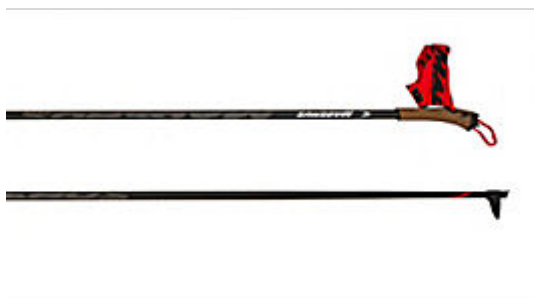
MADSHUS RACE PRO JR STAV

Nano Carbon Race Jr har et solid stavrør i 40 prosent karbonfiber, Race-håndtak i kork som gir et komfortabelt grep, og 3D-støpt Contour Race-stropp som ligger godt og stødig rundt hånden. TBS system.